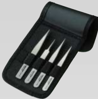
Titan-pincetter, 4 st