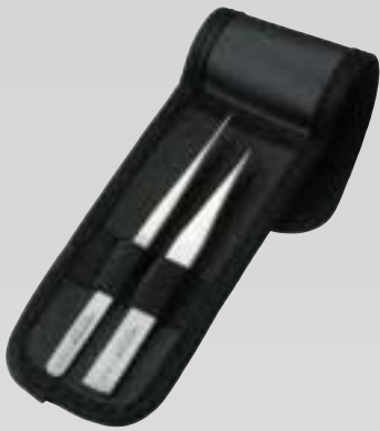
Fina spetsar med hög precision, 2 st