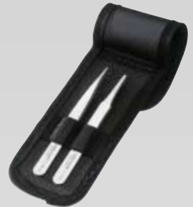
Set pincetten versterkte punt, 2 st.