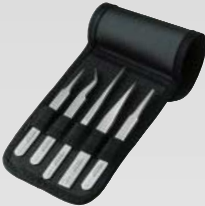
Yleiskäyttöinen sarja, 5 kpl