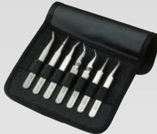
SMD-sarja, 7 kpl

Lindstrom on vuodesta 1856 lähtien kehittänyt ja valmistanut käsityökaluja tarkkuutta vaativiin töihin. Atulat ovat optimaalisen tasapainoisia ja niissä on tarkasti kohdistuvat symmetriset kärjet. Atuloihin on saatavana useita materiaali- ja rakennevaihtoehtoja ja ne soveltuvat haastavimpiinkin tehtäviin.